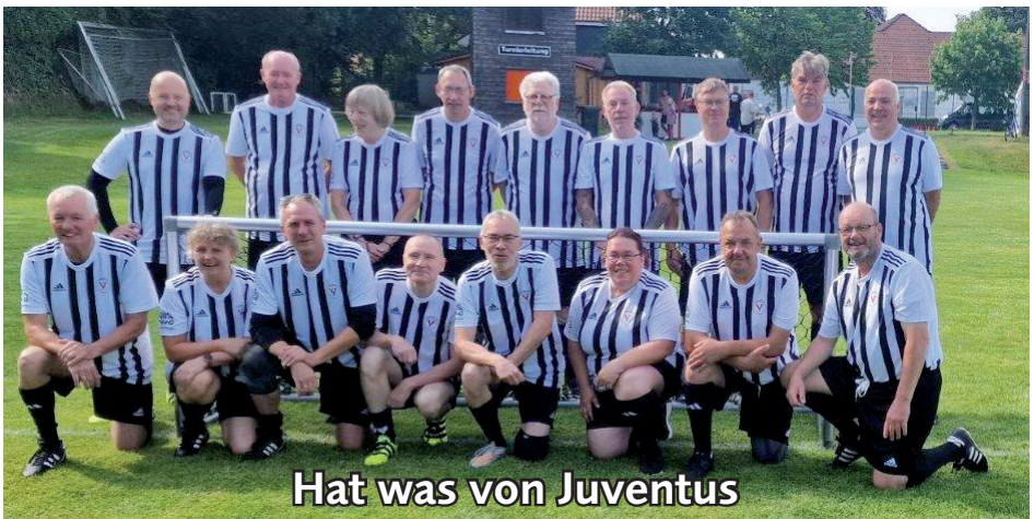
Hat was von Juventus

Nachdem unsere Gehfußball-Freunde aus Neuenburg eine Absage zu verzeichnen hatten, haben wir sehr gerne ausgeholfen, in dem wir eine 2. Mannschaft gemeldet haben.