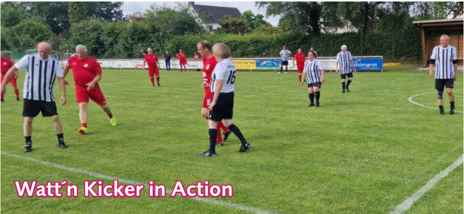
Watt`n Kicker in Action

Letztgenanntes wird hoffentlich immer so bleiben. Wir sind eine „Freizeitmannschaft“ und unser Walking-Football soll vielen Menschen mit „Einschränkungen“ jeglicher Art sportliche Aktivitäten (wieder) ermöglichen.